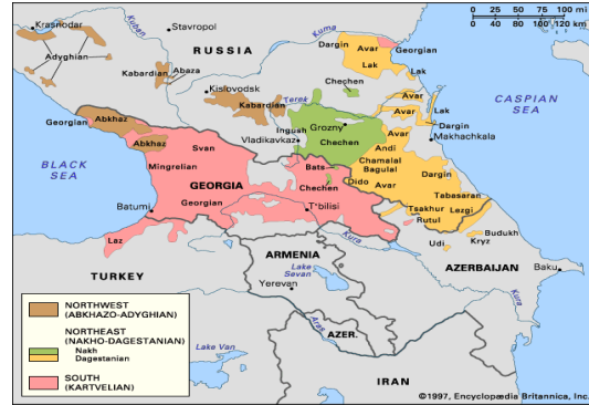
2. იბერო-კავკასიურ ენათა გავრცელების არეალი

რაც შეეხება ისტორიას, ჩვენ მის რამდენიმე ნაწილს გამოვყოფთ და, რაც უფრო ახალ პერიოდებზე ვისაუბრებთ, მით მეტად დეტალურად შევხებით მათ.