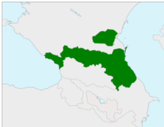
3. ჩრდილოეთ კავკასიის მთიელთა რესპუბლიკის პირობითი დაფარვის არეალი

"1918-1920" - თანამედროვე ქართული საზოგადოებისთვის შედარებით უცნობ ფაქტს წარმოადგენს ის, რომ მეოცე საუკუნის დასაწყისში საქართველოს ხანმოკლე დამოუკიდებლობის პარალელურად, გარკვეული (თუმცა კი საკმაოდ შეზღუდული) დამოუკიდებლობა მოიპოვეს ჩრდილოეთ კავკასიის ხალხებმაც. საქართველოს როლი ჩრდილოეთ კავკასიის მთიელთა რესპუბლიკის ჩამოყალიბებაში იმდენად არსებითი იყო, რომ მისი დამოუკიდებლობა 1918 წლის 11 მაისს ბათუმში გამოცხადდა, ხოლო სახელმწიფოს საგარეო საქმეთა მინისტრი საქმიანობის დიდ ნაწილს თბილისიდან წარმართავდა. სამომავლო მსჯელობისთვის გამოგვადგება თუ აქვე აღვნიშნავთ, რომ ჩრდილოეთ კავკასიელებისთვის საქართველო ფანჯარას წარმოადგენდა გარესამყაროსთან კომუნიკაციისთვის. სწორედ ამგვარმა კომუნიკაციამ განაპირობა, რომ მთიელთა რესპუბლიკის დამოუკიდებლობა საქართველოსთან ერთად აღიარა თურქეთმა, გერმანიამ, აზერბაიჯანმა, ბულგარეთმა და ავსტრია-უნგრეთმა.