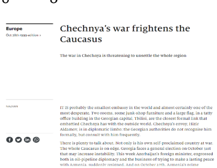
6. The Economist, 1999 წლის 28 ოქტომბერი

მთელმა ამ პერიოდმა მკაფიოდ უჩვენა, რომ რუსეთთან თანამშრომლობის გამოყენებით ერთი კავკასიელი ერის მიერ მეორე კავკასიელი ერის დამარცხება, ჯამში, სარგებლის მომტანი ვერ ხდებოდა ვერც დამარცხებულისთვის და ვერც ე.წ. გამარჯვებული კავკასიელი ერისთვის.