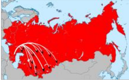
4. ვაინახი ხალხის გადასახლების გეოგრაფია