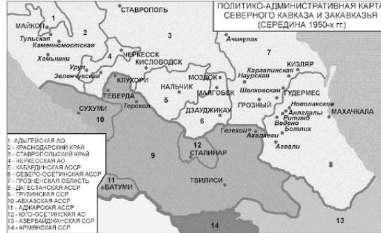
5. კავკასიის რუკა 1944-1957 წლებში

"90-იანი წლები" - 1990-იანი წლების კონფლიქტები და მათში ჩრდილოკავკასიელთა ჩართულობა (მიუხედავად იმისა, თუ რას მივაწერთ ამ მოვლენას), საქართველოსა და ჩრდილოკავკასიელი ხალხების ურთიერთობის ერთ-ერთ მძიმე ეპიზოდს წარმოადგენს, რომელიც დღემდე (და, გარკვეული დოზით, უახლოეს მომავალშიც) განსაზღვრავს საქართველოს კავკასიურ პოლიტიკას. მიუხედავად იმისა, რომ ცნობილი და აღიარებულია რუსეთის გადამწყვეტი როლი საქართველოს ტერიტორიაზე განვითარებულ კონფლიქტებში, ქართველებს არ ტოვებთ ხსოვნა კონფლიქტში მონაწილე ჩრდილოკავკასიელებისა და მათ მიერ ჩადენილი ქმედებების შესახებ. ამის პარალელურად, ქართველთა ძირითადი ნაწილი აცნობიერებს იმასაც, რომ კონფლიქტში მათი მონაწილეობა სწორედ კავკასიელთა შორის ურთიერთობებში დამატებითი ბზარის შეტანის განზრახვით იყო მოტივირებული და რომ, შესაძლოა, ეს სულაც არ ასახავდა ჩრდილოკავკასიელთა რეალურ დამოკიდებულებას ქართველთა მიმართ.