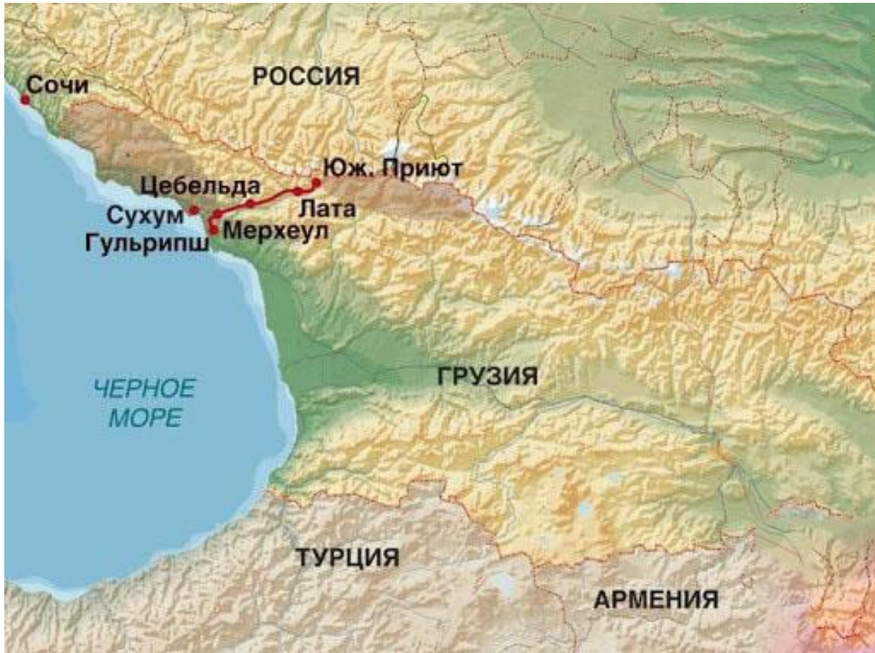
სურ 5 - სოხუმის სამხედრო გზის პროექტი

მათი მხრიდან უკვე მესამე ათწლეულია მიმდინარეობს ერთგვარი კბილის მოსინჯვა აფხაზების მზაობისთვის, ნებაყოფლობით შეასრულონ რუსეთის სურვილები.