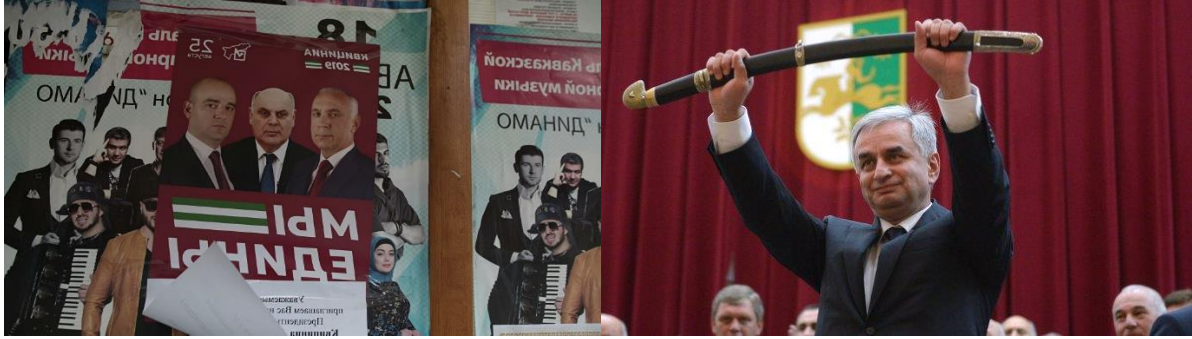
სურ 3 - ალხაზ კვიცინიას საარჩევნო პლაკატი სურ 4 - რაულ ხაჯიმბა

მიუხედავად იმისა, რომ კვიცინიას უკვე გასაჩივრებული ჰქონდა არჩევნების შედეგები, რუსეთის პრეზიდენტმა ხაჯიმბას დაუყოვნებლივ მიულოცა გამარჯვება და, მეტიც, აფხაზეთისთვის შეჩერებული ფინანსური დახმარებაც მოკლე დროში გასცა. ამგვარად, რუსეთმა ცხადად დააფიქსირა, რომ იგი ხაჯიმბას პრეზიდენტობის გაგრძელებას მხარს უჭერდა, თუმცა არჩევნების ლეგიტიმურობის მიმართ კითხვები არ მოხსნილა, მათ შორის, არც სამართლებრივ ჭრილში (საუბარია დე-ფაქტო აფხაზურ სამართალზე) და 2019 წლის სექტემბერში დაწყებული დავა 2020 წლის იანვრამდე გადაუწყვეტლად მოვიდა.